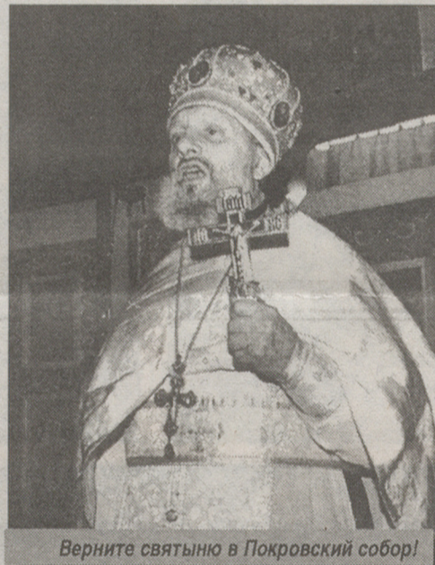
Верните святыню в Покровский собор!

Приходской Совет Покровского собора не стал обращаться в соответствующие органы в надежде на то, что посягнувшие на святыню осознают ошибку, всю глубину своего